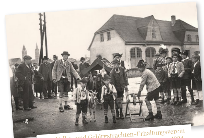
Der Volks- und Gebirgstrachten-Erhaltungsverein „Isartaler“ beim Herbstschau-Festzug 1924, in der Bahnhofstrasse.